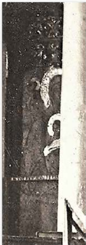
Εικ. 61. Η εικόνα της Παναγίας Ζωοδόχου Πηγής, ΧΑΕ 6006.

Η εικόνα φαίνεται στη φωτογραφία ΧΑΕ 6006 και βρισκόταν στο τέμπλο του Παρεκκλησίου του Αγίου Νικολάου. Στο κέντρο της εικόνας, καταλαμβάνοντας το μεγαλύτερο μέρος της, παριστανόταν μετωπική η Παναγία μέσα σε πολύπτυχη φιάλη να κρατάει τον μικρό Χριστό (εικ. 61). Ο Χριστός είχε στραμμένο το κεφάλι του προς τα αριστερά και μάλλον κρατούσε ανοιχτό ενεπίγραφο κώδικα Ευαγγελίου. Εκατέρωθεν της κεφαλής της Παναγίας εικονίζονταν οι αρχάγγελοι Μιχαήλ και Γαβριήλ. Αργυρά ελάσματα κοσμούσαν τα φωτοστέφανα των ιερών μορφών, το δεξί χέρι της Παναγίας και το Ευαγγέλιο του Χριστού. Είναι άγνωστο αν στο κάτω μέρος της εικόνας παριστανόταν ορθογώνια παραλληλόγραμμη δεξαμενή με μορφές λαϊκών και κληρικών. Η εικόνα είχε καλυφθεί από στρώμα αιθάλης.