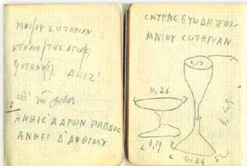
Εικ. 107. Σελίδες από το Σημειωματάριο του Γ. Λαμπάκη με τμήμα της επιγραφής της αρχιερατικής ράβδου, την επιγραφή του δικανικίου του μητροπολίτη Σμύρνης Ανθίμου και σκαρίφημα του αγίου ποτηρίου και του αγίου δισκαρίου, που φυλάσσονταν στο Σκευοφυλάκιο του Ναού της Αγίας Φωτεινής.

καταστροφές που έπληξαν τη Σμύρνη είχαν ως αποτέλεσμα να σωθούν λίγα ιερά κειμήλια στο Σκευοφυλάκιο του Ναού της Αγίας Φωτεινής. Αυτά ήταν μίτρες, αρχιερατικά άμφια και ιερά σκεύη.